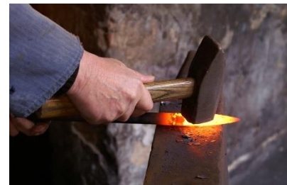
De smid hamert op het ijzer

23 De mensen konden gereedschap maken door het 24 te smeden. Het ijzererts werd warm gemaakt en de 25 smid* hamerde erop om het ijzer hard te maken en 26 er een gereedschap te maken. Dit deed de smid op 27 een smeedijzer. Dit heet smeden. 28 Een smid maakte gereedschap. Bijvoorbeeld een 29 bijl, dolk*, speer, schep, speerpunt en pijlpunt.