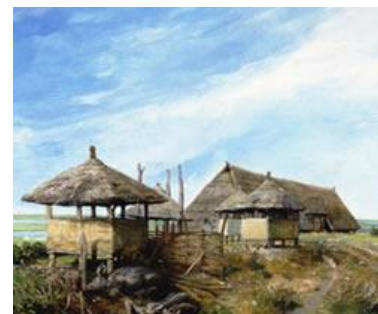
Huis waarin de boeren woonden

31 De meeste boeren leefden in huizen bij elkaar. Maar 32 steeds vaker stonden de boerderijen alleen. De boeren 33 bouwden spiekers. Dit zijn schuurtjes op hoge palen 34 waarin ze spullen bewaarden. 35 Op het land verbouwden de boeren graan, bonen en 36 olie. De boeren zorgden ervoor dat het land goed 37 bemest werd. Dit deden zij door het land soms braak 38 te leggen. Dit betekent dat ze er niks zaden. Ze laten 39 de koeien op het land lopen en deze poepen goede 40 mest op het land.